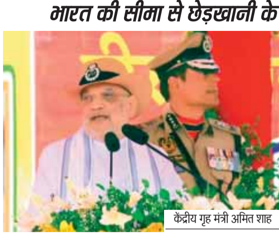
केंद्रीय गृह मंत्री अमित शाह

‘ऑपरेशन सिंदूर’ में पाकिस्तान को दिया था करारा जवाब यह संकल्प है 31 मार्च 2026 तक देश नक्सलवाद से मुक्त हो जाएगा