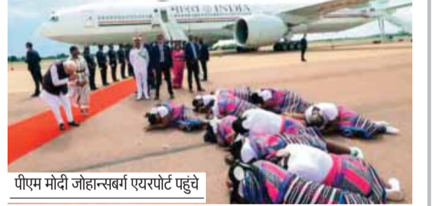
पीएम मोदी जोहान्सबर्ग एयरपोर्ट पहुंचे

पीएम मोदी जी20 शिखर सम्मेलन में भाग लेने के लिए शुक्रवार को दक्षिण अफ्रीका के जोहान्सबर्ग एयरपोर्ट पहुंचे, जहां उनका भव्य स्वागत किया गया है। उनके स्वागत में एयरपोर्ट पर पहले से ही कई स्थानीय कलाकार मौजूद थे। इन कलाकारों में खास तौर पर महिलाएं थीं। जैसे ही पीएम मोदी ने अपने प्लेन से बाहर कदम रखा तो उनका ध्यान इन महिला कलाकारों पर गई। ये कलाकार अपने पारंपरिक नृत्य से पीएम का स्वागत कर रही थीं। पीएम मोदी के स्वागत के दौरान कुछ ऐसा हुआ जो शायद पहले कभी अफ्रीका में किसी भारतीय पीएम के स्वागत में कभी नहीं हुआ। पीएम मोदी के इस दौरे को खास बनाने के लिए स्वागत नृत्य के बाद उन्हें विशेष धन्यवाद दिया और जमीन पर दंडवतकर उन्हें सम्मान दिया। स्वागत करने का ये तरीका अब सोशल मीडिया पर जमकर वायरल हो रहा है।